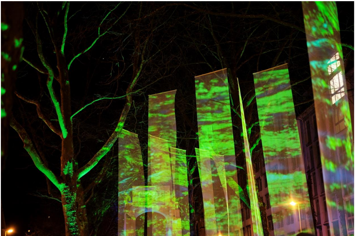
Kunstnacht Konstanz Kreuzlingen 2023 "bewegt"