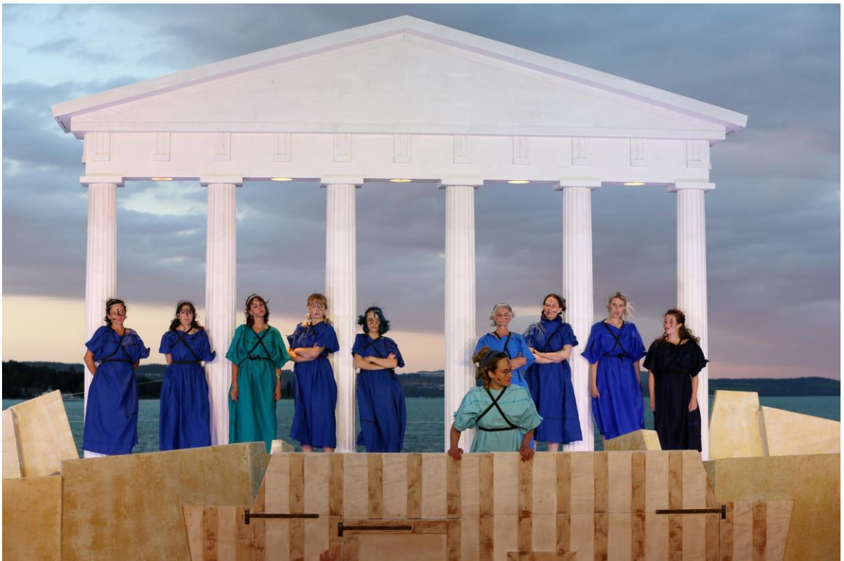
See-Burgtheater Kreuzlingen "Lysistrata", 2022