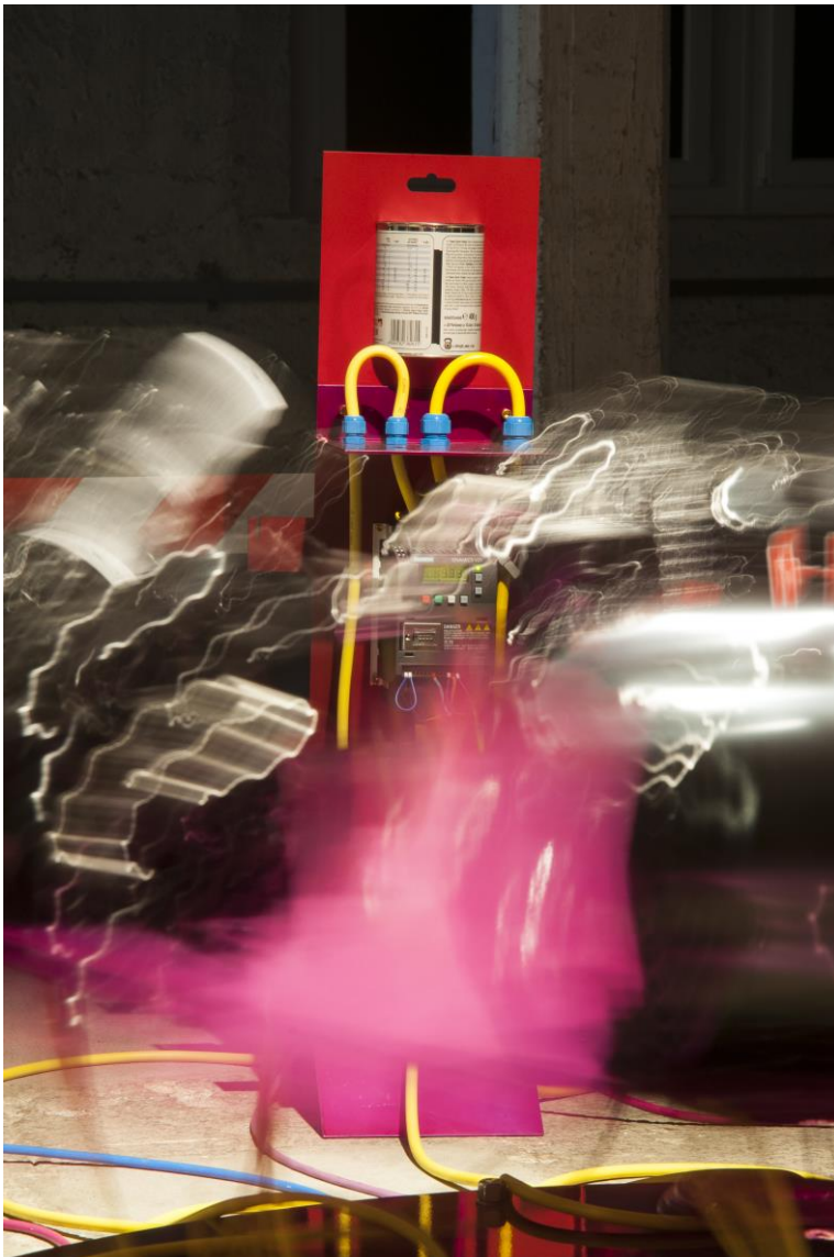
Kunstraum Kreuzlingen, Boris Petrovsky "Abwesenheitsassistent", 2017